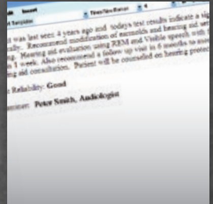
Página de informes del Diagnostic Suite (sólo AS608e)