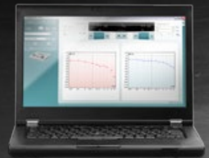
Software Diagnostic Suite (sólo AS608e)

El equipo funciona con 3 pilas AA estándar o mediante fuente de alimentación externa con aprobación médica. Las pilas tienen una duración de seis (6) meses.