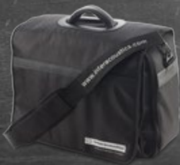
Maletín de transporte

El AS608e incluye el procedimiento de prueba de tono puro automático Hughson Westlake. Al finalizar la prueba, es posible recuperar los resultados de la memoria interna de la unidad con gran facilidad y visualizarlos en el software Diagnostic Suite PC.