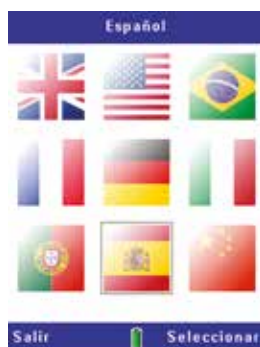
Interfaz de usuario multilingüe