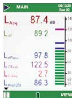
Medición de banda ancha

Los parámetros medidos se visualizan en distintos colores, y los gráficos de barras se ilustran con estos mismos colores para proporcionar una comprensión más fácil del estado de ruido.