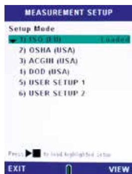
Selección de configuración