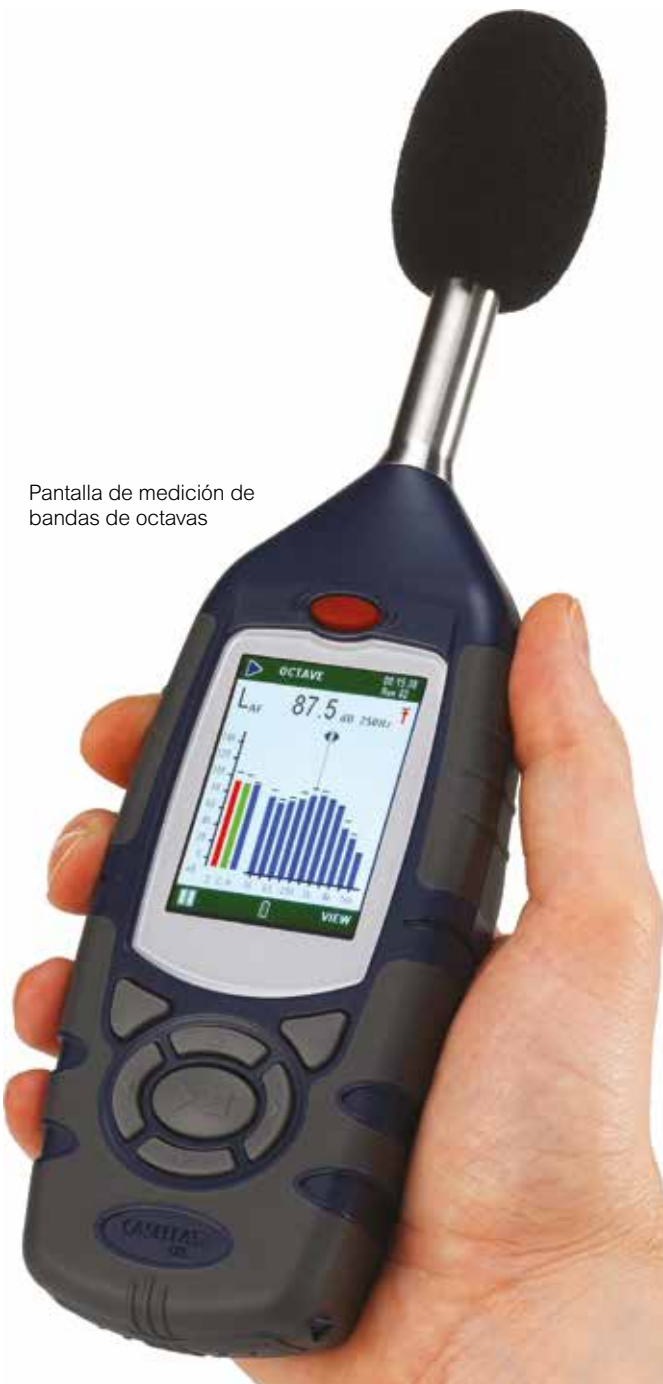
Pantalla de medición de bandas de octavas

Hay disponibles diferentes modelos dependiendo de sus requisitos para el uso en la medición del ruido dentro del entorno laboral general, o para satisfacer requisitos específicos de higiene industrial donde el análisis de bandas de una octava es necesario para seleccionar protección auditiva eficaz.